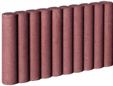
Ø 6 x 47 x 25