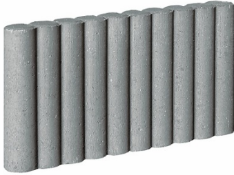
Ø 6 x 47 x 25