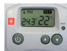
Abb. B: Modus Heizbetrieb in eingeschaltetem Zustand, Verbraucher nicht eingeschaltet, da SOLL-Temperatur unterhalb der IST-Temperatur