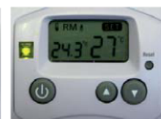
Abb. C: Modus Heizbetrieb in eingeschaltetem Zustand, Verbraucher eingeschaltet, da IST-Temperatur unterhalb der SOLL-Temperatur