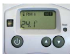
Abb. A: Modus Heizbetrieb im ausgeschalteten Zustand